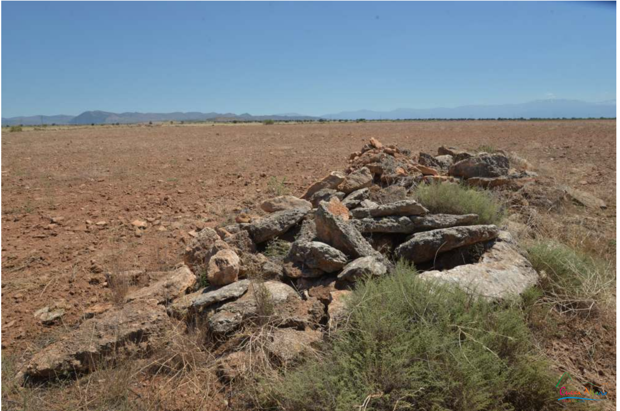
Posición presunta dolmen 090