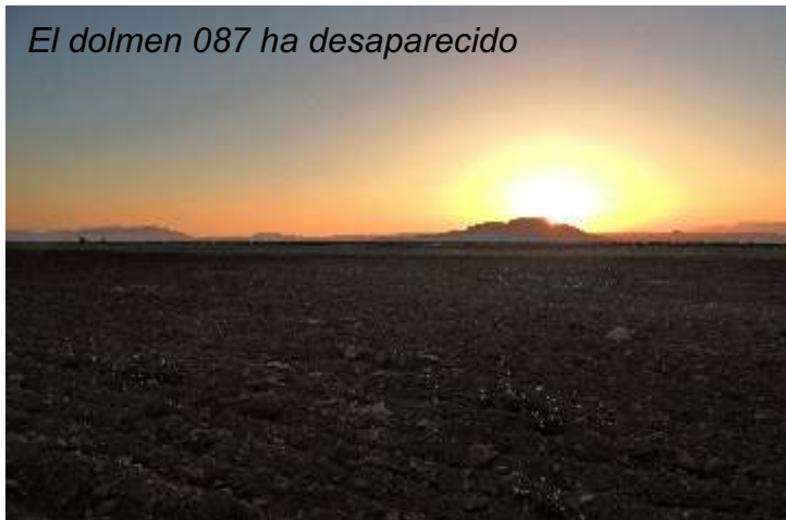
El dolmen 087 ha desaparecido

En esta mitad del Altiplano y sita a medio kilómetro del borde se encontraba otra de las necrópolis de Parque Megalítico de Gorafe. Esta contaba con 14 dólmenes que hoy en día se encuentran en mal estado de conservación. Algunos de ellos cuentan con apilamiento de piedras y tierra posteriores, por lo que no delatan que fueran originariamente sepulturas megalíticas. Esperamos que Bienes Culturales los proteja y limpie para que no se terminen de perder como sucedió con el dolmen 087, completamente arrasado. Algunos dólmenes de la necrópolis del Llano de la Cuesta de Guadix como el 90, 92, 94,95, y 96 están absolutamente irreconocibles bajo túmulos de piedra y tierra. Aunque su localización la tenemos, he preferido no fotografiar ese amasijo de piedras irreconocible como dolmen, fotografiando en su lugar la zona que presumiblemente ocupaban.