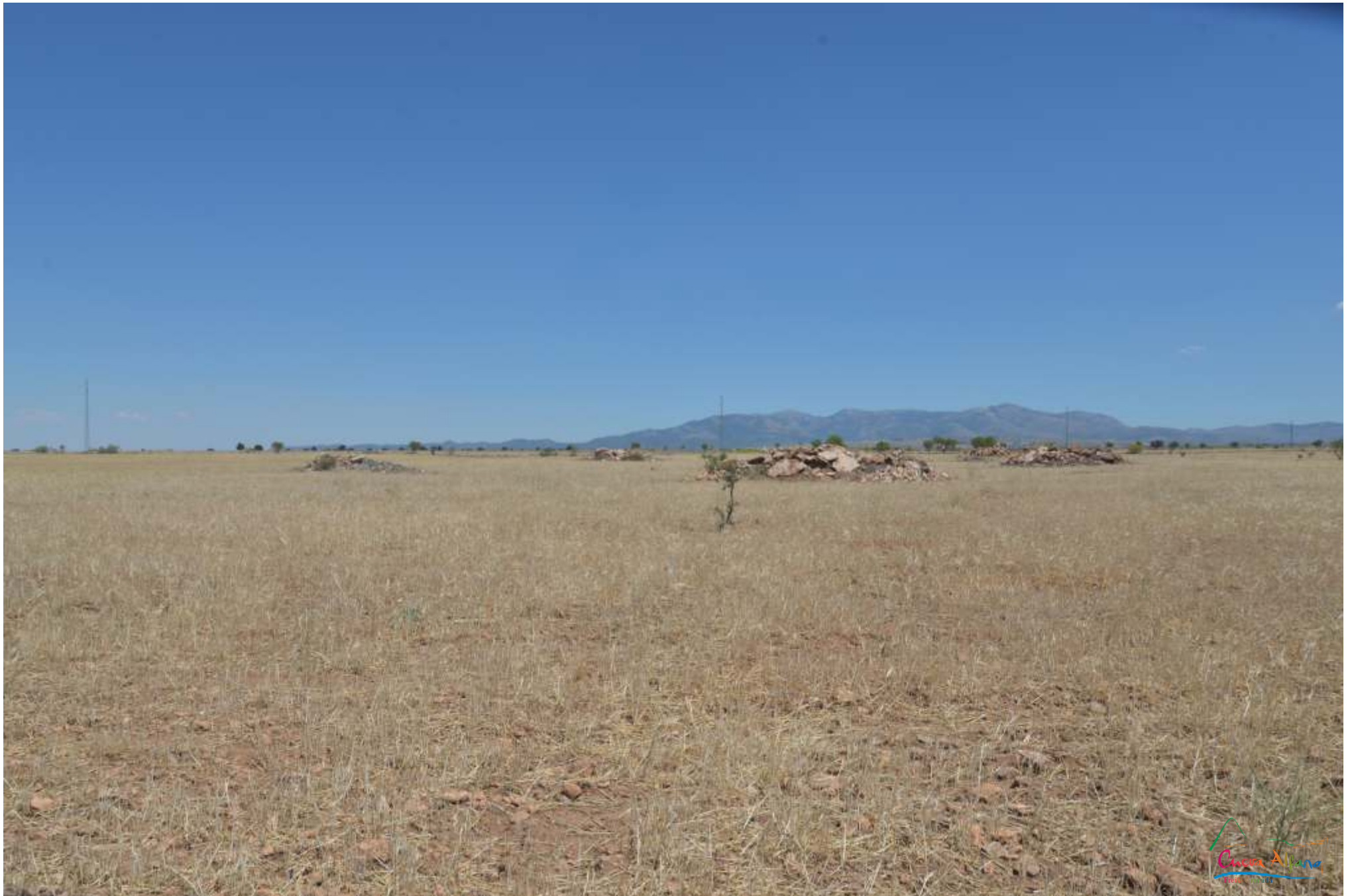
La zona del Llano de Guadix donde se encontraban los dólmenes 90, 92, 94, 95 y 96