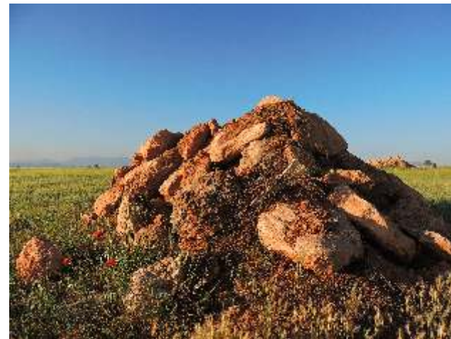
Al día de hoy, siguen hechando tierra y piedras