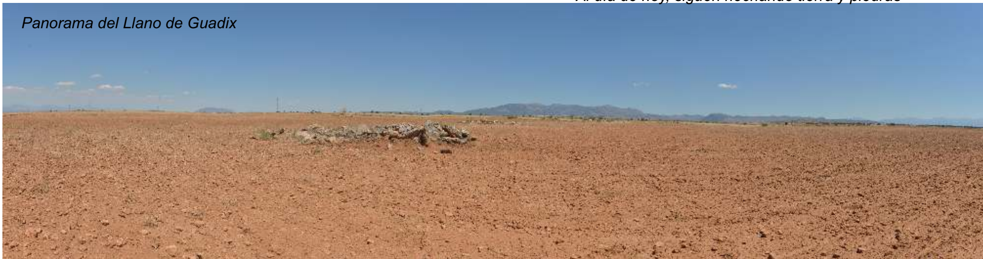
Panorama del Llano de Guadix