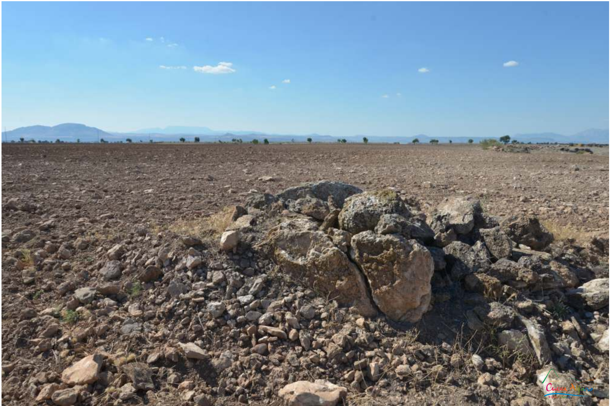
Las labores con medio mecánicos han podido quebrar un ortostato del dolmen 170